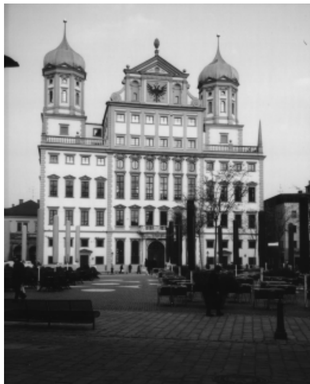
Das von Elias Holl erbaute Augsburger Rathaus