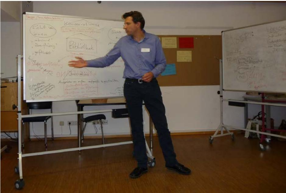
Text: S. Berndsen